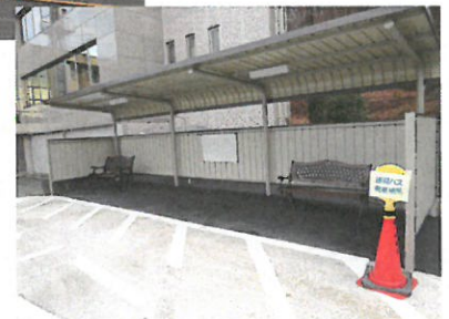
送迎バス発着場所(本館玄関付近)